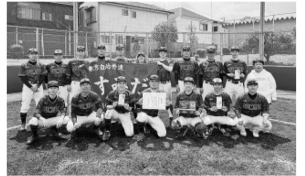
優勝した墨田区職労チーム

東京自治労連軟式野球大会が、4月から始まりました。 初日が雨のため順延となり、当初予定していた3チームが棄権となり、7チームによる熱戦が繰り広げられました。 25日に決勝戦があり、足