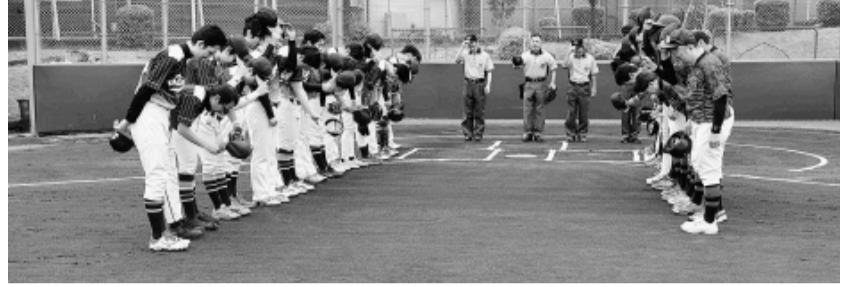
決勝戦は「品川区職労」(左)対「墨田区職労」(右)

東京自治労連軟式野球大会が、4月から始まりました。 初日が雨のため順延となり、当初予定していた3チームが棄権となり、7チームによる熱戦が繰り広げられました。 25日に決勝戦があり、足