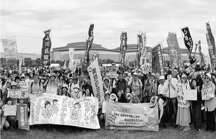
東京自治労連の参加者

東京自治労連からも2222名が参加し、晴天のもと解散地点のお台場まで元気なパレードを行いました。東京自治労連は現行憲法を守る立場を堅持する労働組合として、今後も市民の皆さんと連携する活動に取り組んでいきます。